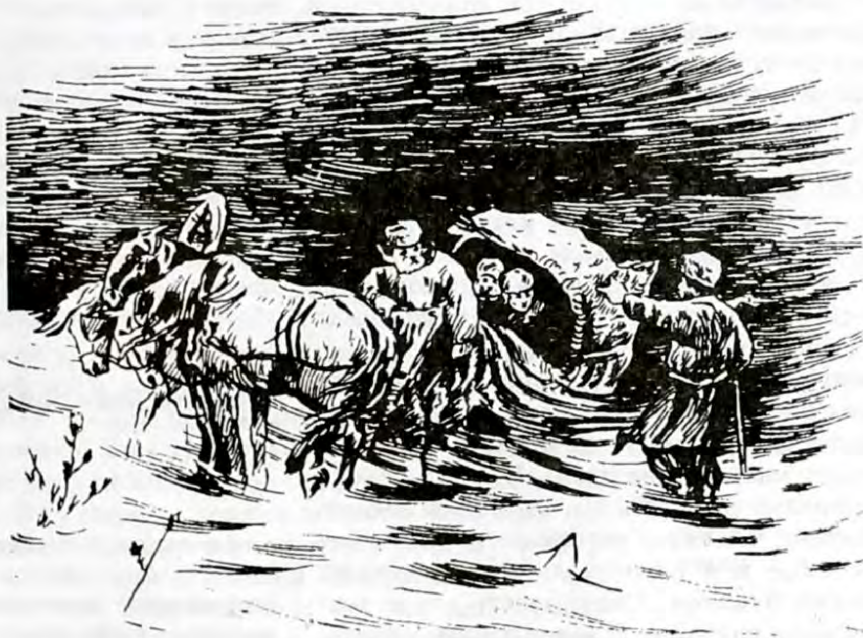
Встреча в пути.

ула́живая у́пряжь (поправля́я у́пряжь) – аттын жабдыгын ондоп