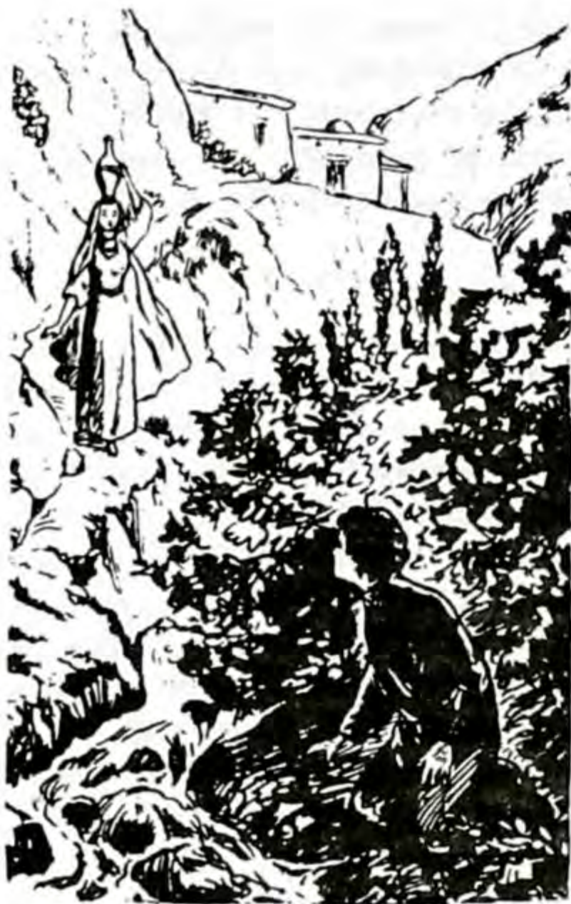
Встреча с грузинкой.