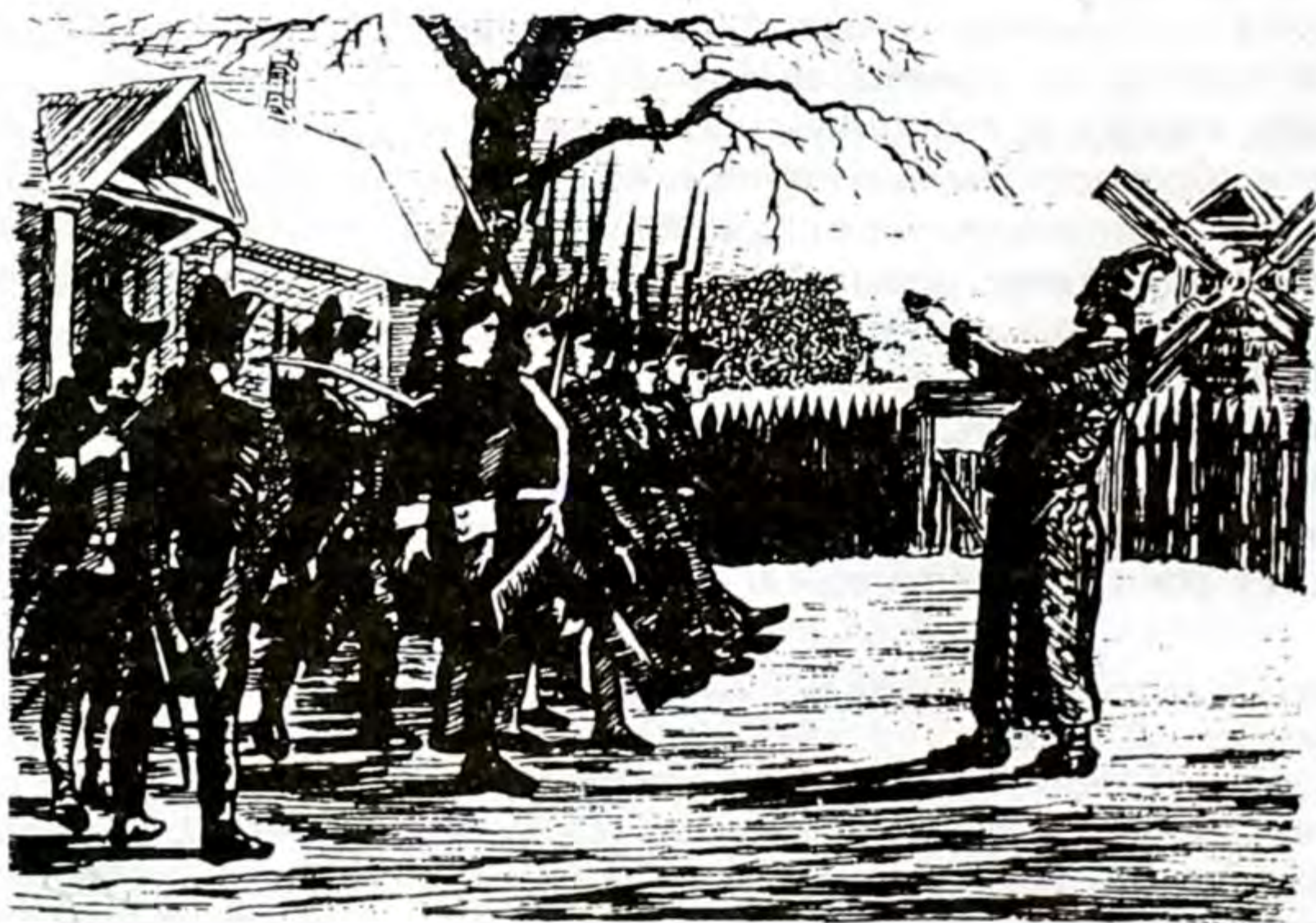
Обучение солдат в Белогорской крепости.

Подходя к комендантскому дому, мы видели на площадке человек двадцать стареньких инвалидов... Они выстроены были во фронт. Впереди стоял комендант, старик бодрый и высокого роста, в колпаке, и в китайчатом халате. Увидя нас, он к нам подошёл, сказал мне несколько ласковых слов и стал опять командовать. Мы остановились было смотреть на учение; но он просил нас идти к Василисе Егоровне, обещаясь быть вслед за нами. «А здесь, — прибавил он, — нечего вам смотреть».