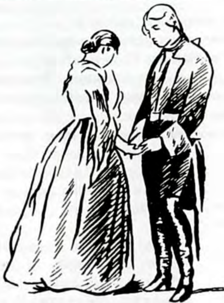
Прощание Гринёва с Машей.

задыхаться — демигип встревоженный — тынчсыздануу